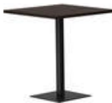
rq light t-2004