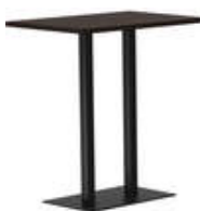
rq light t-2009