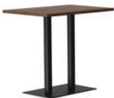
rq light t-2008