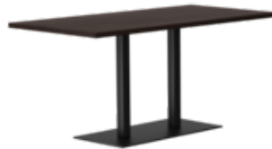
rq light t-2002