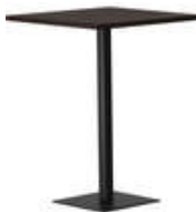
rq light t-2006