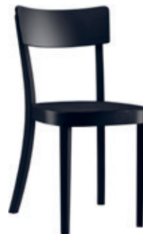
classic Conception d'usine, 1918

Les plateaux des tables sont soit en bois massif, soit plaqués bois, soit recouverts de linoléum. S'ils ne sont pas en bois massif, le piètement et les pieds de table sont en fonte ou en acier inoxydable chromé. Nous sommes ouverts à d'autres idées et souhaits d'exécution.