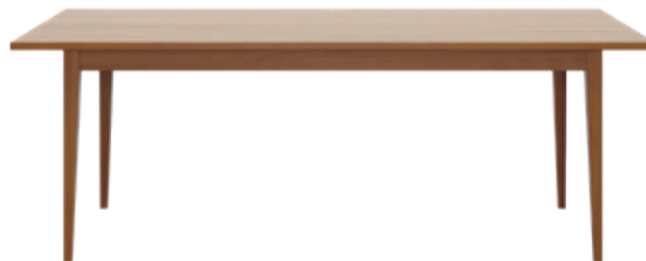
sigma Conception d'usine, 1944