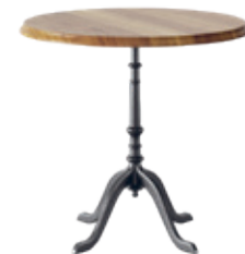
gloria Conception d'usine, 1925