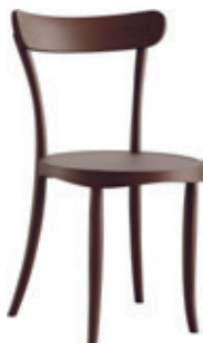
belair Herzog & de Meuron, 2024