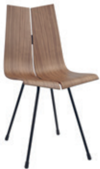
ga stuhl Hans Bellmann, 1955