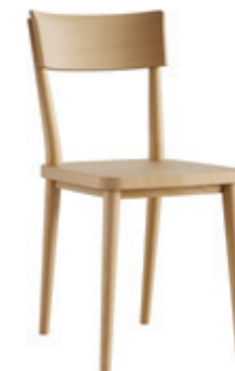
honett Blocher Partners, 2022