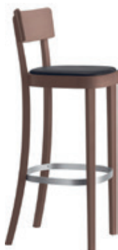
classic barhocker Conception d'usine, 1918