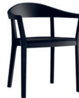
klio Studio Hannes Wettstein, 2014