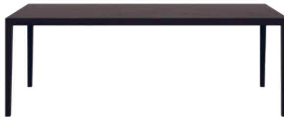
mi Waeber/Dickenmann, 2011