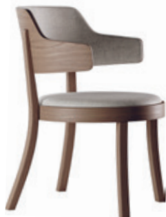
seley lounge Frédéric Dedelley, 2019