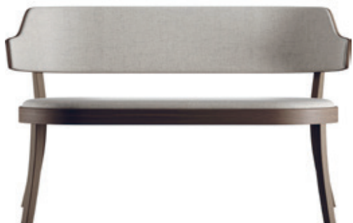
seley lounge bank Frédéric Dedelley, 2019