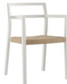
dom Studio Meda, 2017