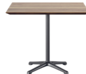
delta Conception d'usine, 1932