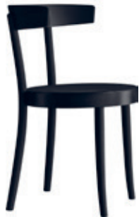
select Werner Max Moser, 1934