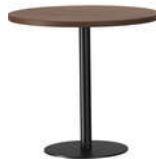
RQ Light t-2003