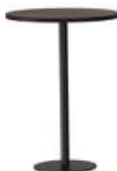
rq light t-2007